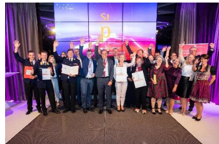
Abbildung 2: Staatspreisgewinner 2021

Die Gewinner werden im Rahmen der Winners' Conference vorgestellt und feierlich ausgezeichnet, neben dem*der Staatspreisträger*in werden auch die Categoriesieger*innen und Jurypreis Gewinner*innen geehrt.